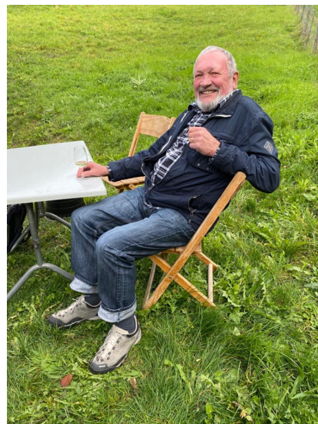
18.10. 2020: «Räbhüsli» Birmenstorf